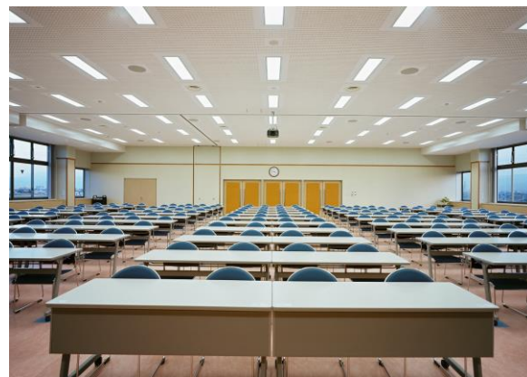
3 階 研 修 室