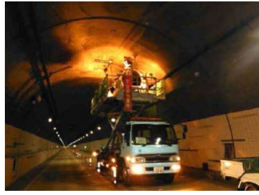
トンネル設備交換