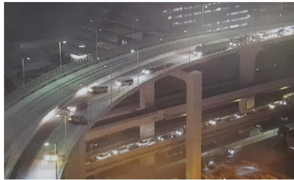
車両の滞留 ＜首都高速道路 台場線＞