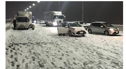
首都高速中央環状線の立ち往生発生状況 <令和4年1月6日>

○このほか、主要な国道においても冬用タイヤやチェーン未装着車によるスリップ事故が多発しました。