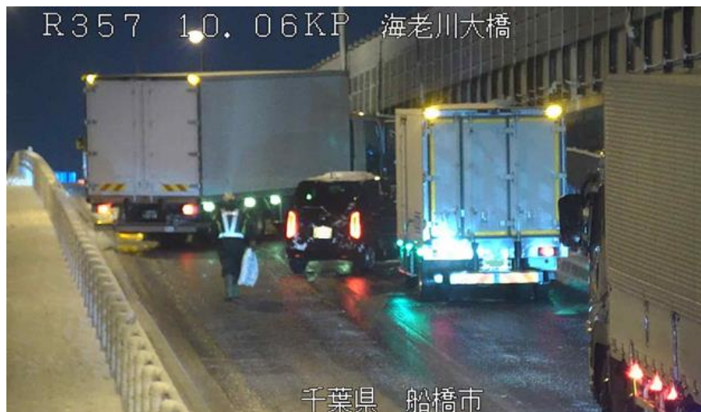
冬用タイヤやチェーン未装着車両によるスリップ事故 ＜国道357号＞