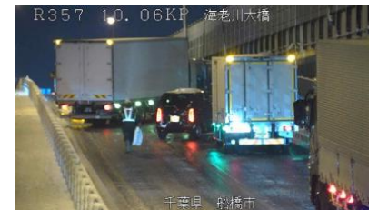
国道357号 路面凍結によるスリップ事故 <令和4年1月7日>