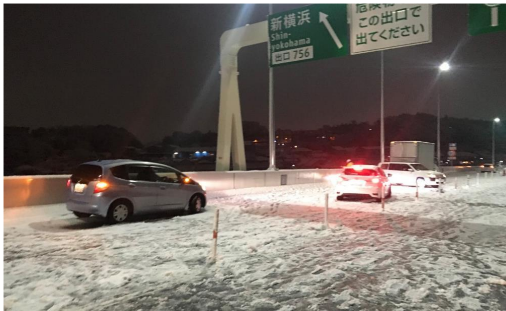
冬用タイヤやチェーン未装着車両による立ち往生 ＜首都高速道路 横浜北線＞